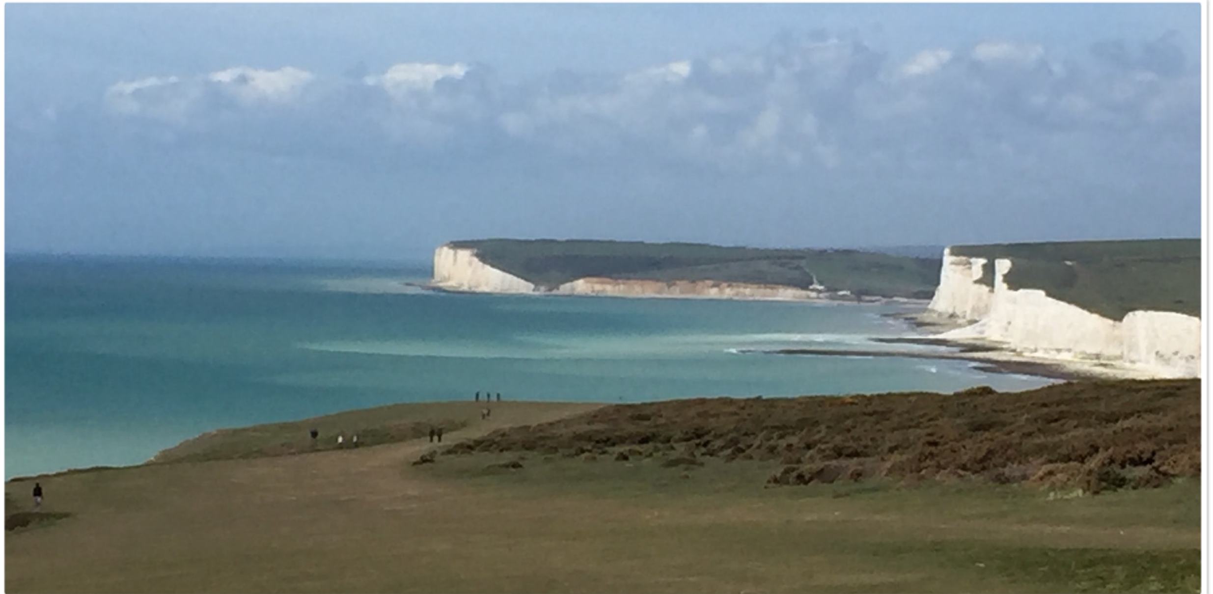
Fotos von der Küste von Eastbourne

Mit den beiden ersten Stufen, den allgemeinen und persönlichen Verhaltensempfehlungen, aus dem Raja-Yoga können wir wohl ein Leben lang üben: Zu den yama und den njyama gehören beispielsweise Gewaltlosigkeit und Zufriedenheit. Wenn wir unser Verhalten diesbezüglich im Alltag überprüfen, fällt uns vielleicht auf, dass wir zwar auf einen Fleischkonsum verzichten, jedoch ungeniert eine