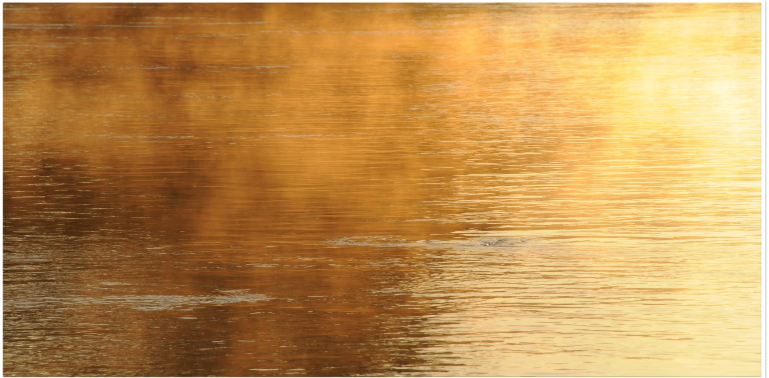
Bilder aus Andelfingen und Eschenz

Die wahre Kunst von Samyama ist nun nicht der ewig währende Versenkungszustand, sondern Samadhi, Meditation und Konzentration wieder nach aussen zu tragen, das Innerste wieder mit dem Äussersten zu verbinden und diesen Strom nie abreißen zu lassen.