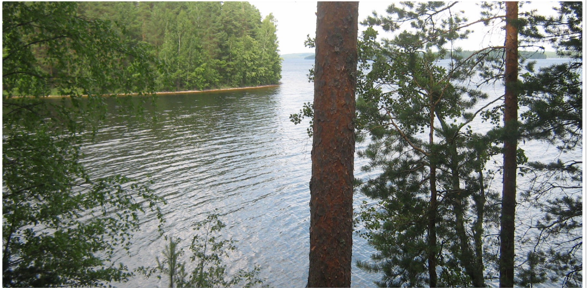
Fotos aus Finnland

Bleiben wir in dieser Überzeugung hängen, können diese Lebensgeschenke ein Hindernis werden und uns in einer Opferrolle leiden lassen. Dieses Verhalten würde dem Karma die Rolle einer Schicksalsgöttin zuschreiben, die eigenmächtig bestimmt, was mit uns geschieht. Um sich daraus zu lösen, braucht es die Erkenntnis, dass wir selbst Regie führen und somit aktiv in das Geschehen eingreifen können.